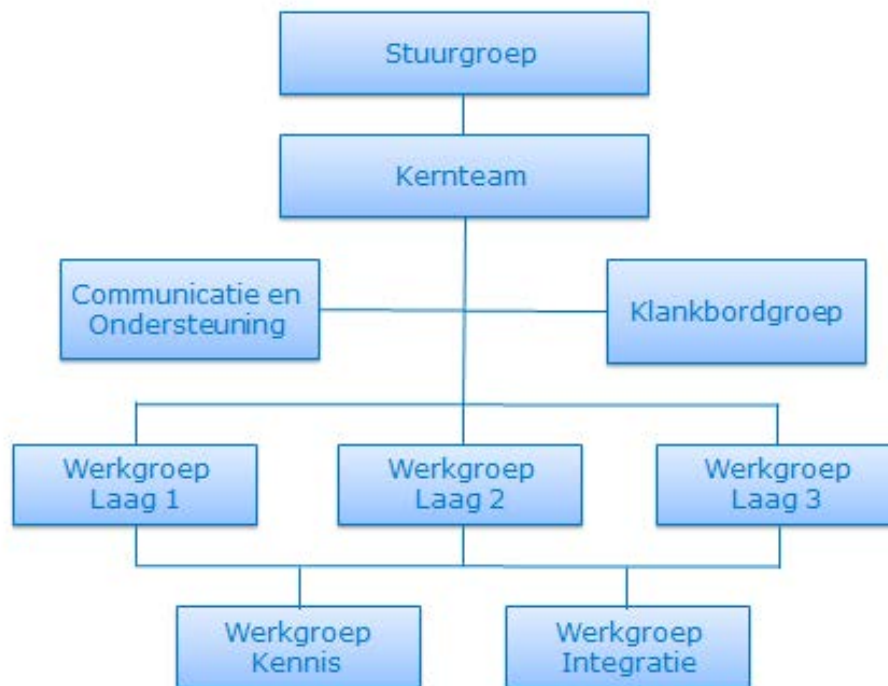
Figuur 7. Organisatiestructuur. Voorsnog wordt rekening gehouden met een aparte werkgroep die zich richt op de kennis- en innovatieagenda, terwijl perspectief 2050 en uitvoeringsagenda 2030 samengenomen worden vanuit werkgroep integratie.

kernteam te stroomlijnen worden (ad-hoc) werkgroepjes per activiteit in gericht. Daarbij zal in de tijd het accent verschuiven van werk dat start vanuit de de drie lagen naar werk om de integratieslag te maken naar richtinggevend perspectief, uitvoeringsagenda en kennis- en innovatieagenda.