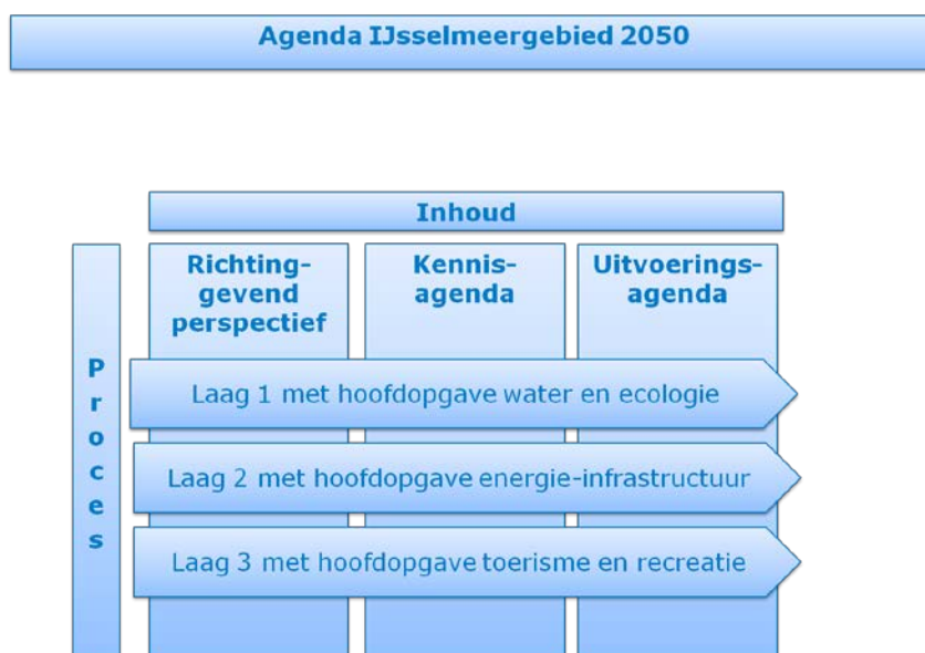
Figuur 1. De aanpak van de gebiedsagenda volgens de lagenbenadering.

De hoofdlijnen van de aanpak van het vervolgproces van Agenda IJsselmeergebied 2050 zijn verbeeld in Figuur 1-3. Het werkprogramma is in meer detail uitgeschreven in Hoofdstuk 3. Figuur 1 geeft de drie onderdelen van de Gebiedsagenda weer en laat schematisch zien dat hieraan vanuit de drie lagen (systeem, netwerken, gebruik) wordt gewerkt. Vanuit iedere laag wordt een bijdrage geleverd aan het richtinggevend perspectief, de kennis- en innovatieagenda en de uitvoeringsagenda.