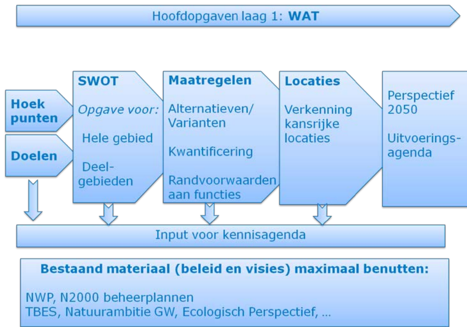
Figuur 3. De aanpak van de wat-vragen, uitgewerkt voor de systeemlaag.

met het vaststellen van de hoekpunten van het speelveld en de doelen voor deze laag.