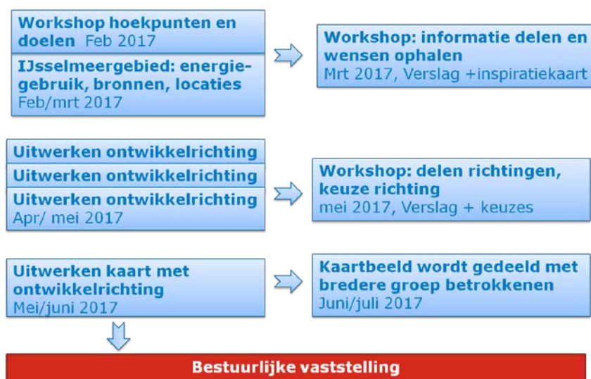
Figuur 5. Overzicht van bijeenkomsten die worden georganiseerd voor de aanpak van de energieopgave en de producten die worden opgeleverd.