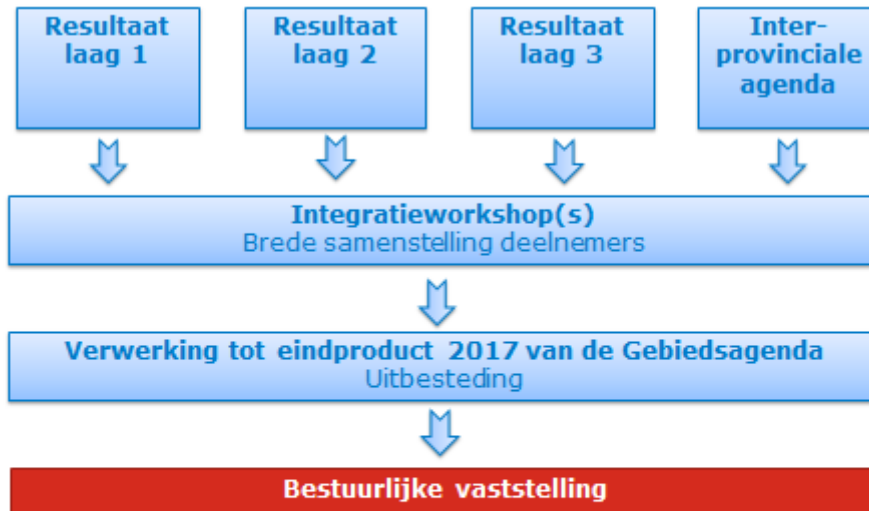
Figuur 6. Opzet van de integratiestap in het werkproces voor de Gebiedsagenda in 2017.